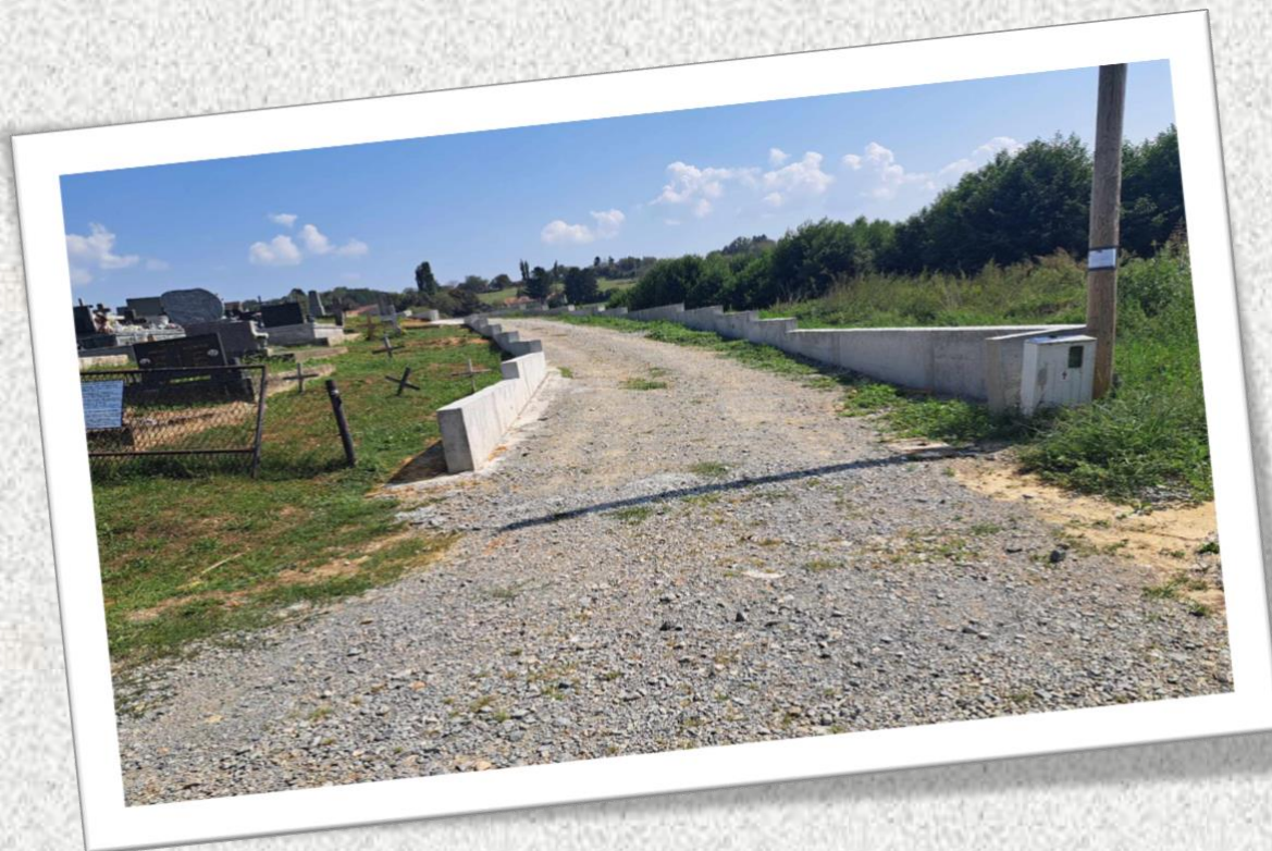
Slika 1. i 2. – Uređenje groblja u općinskim naseljima