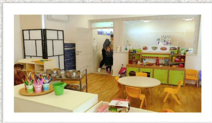
Slike 3. i 4. – Dječji vrtić „Palčica“ – podružnica Zrinski Topolovac

Dječji vrtić u Zrinskom Topolovcu dovršen je 2024. godine, i započeo je s radom, na radost mališana koji ga pohađaju. Općina će u 2025. nastaviti sufinancirati boravak djece u vrtiću.