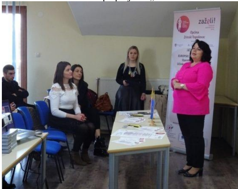
Slika 2: Aktivnosti u sklopu projekta „Zaželi“