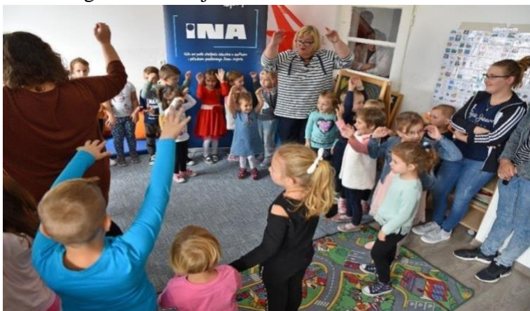
Slika 1: Igraonica za djecu