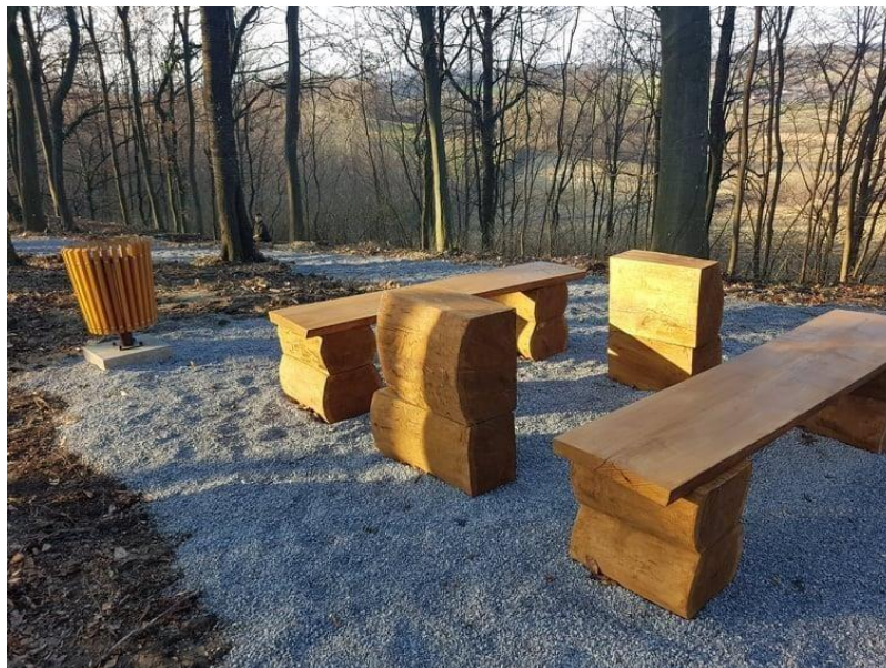
Slika 3: Poučna staza