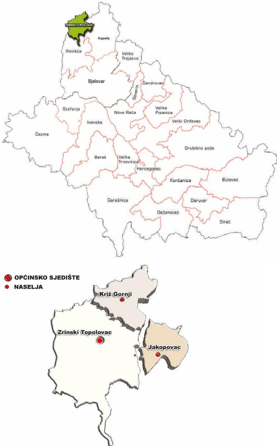
Slika 1. Kartografski prikaz Općine Zrinski Topolovac